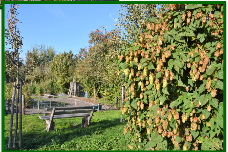
Hop in de houtsingel