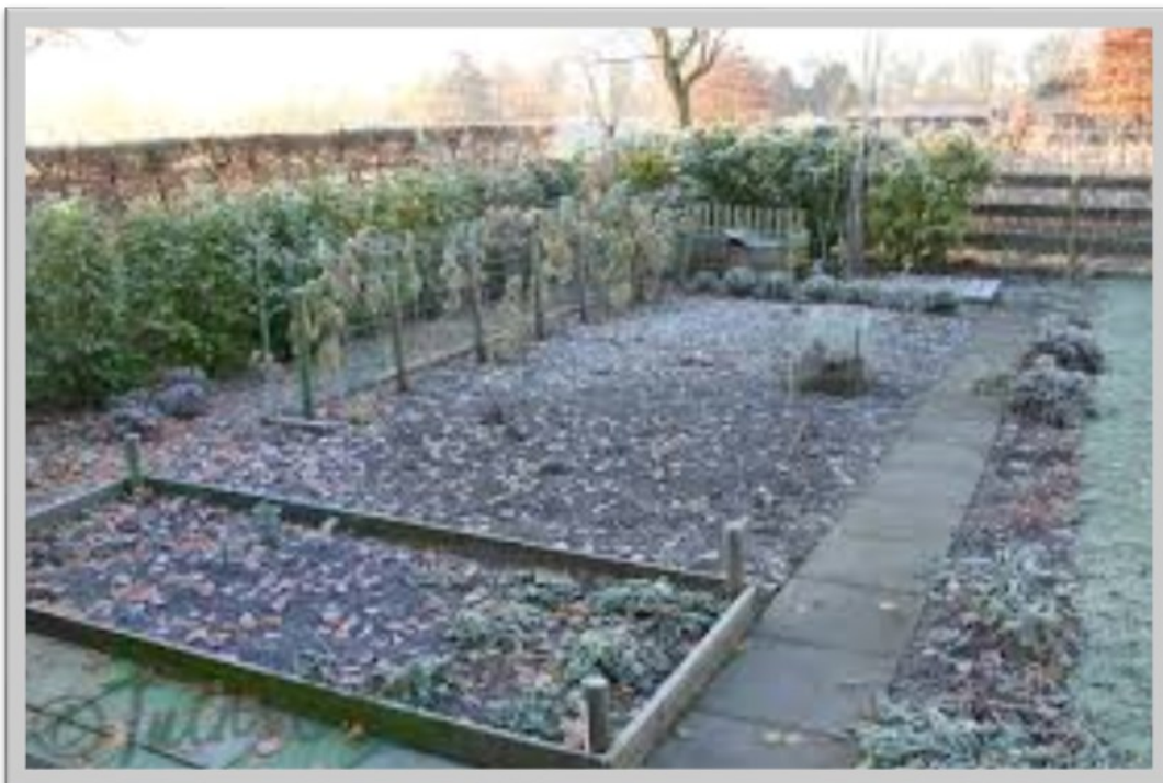
Winter in een moestuin