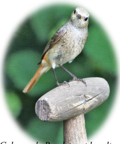
Gekraagde Roodstaart houdt van houtsingels

Een groententuin staat niet op zich. Het is een deel van een ecosysteem waarin tussen planten en dieren relaties bestaan die we in de tuin nodig hebben. Bijen, hommels, vlinders en een heleboel andere insecten hebben we nodig om onze groenten en fruit te bestuiven. Denk aan je appelboom of de stokslabonen en courgette. Rupsen en slakken willen we niet, gelukkig zijn er vogels die ze voor ons wegpikken. Ook padden en egels eten graag slakken. We hebben o.a. regenwormen nodig om organisch materiaal af te breken tot compost. Het is niet zo moeilijk om meer voorbeelden te noemen. Heel veel nuttige dieren voor onze tuin hebben direct of indirect te maken met de aanwezigheid van houtsingels. Insectenetende zangvogels broeden in de boswal of anders wel in de nestkast die je er hebt opgehangen. In de strooisellaag doet de egel een winterslaap. Vlinders leggen hun eitjes op waardplanten in de houtsingel. Een wal van takken is helemaal een paradijs voor vogels en kleine zoogdieren.