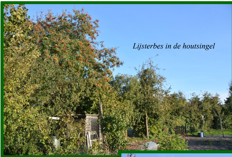
Lijsterbes in de houtsingel

Toen het boerenbedrijf nog extensief en kleinschalig was liepen er door het landschap linten van houtwallen en houtsingels met een lengte van honderden kilometers. Even voor de goede orde. Je spreekt van een houtwal als de beplanting ook echt op een verhoging (wal) staat. Zo'n verhoging ontstaat bijvoorbeeld door het graven van greppels. Bij houtsingels bestaat die verhoging niet. Houtwallen en singels waren onderdeel van de agrarische bedrijfsvoering. Ze fungeerden vaak als perceelscheiding of veekering en leverden geriefhout. Toen de landbouw intensiever werd hadden ze geen functie meer. Houtsingels en geriefhoutbosjes verdwenen uit het landschap. Het oude agrarisch cultuurlandschap verdween en wat kregen we er voor terug ? Zelf nu nog worden deze landschapselementen gerooid. Veel bewoners van de Achterhoek en Twente zien het met lede ogen aan en trekken aan de bel. Hetzelfde gebeurt in de gemeente De Wolden. Vanwege de grote ecologische waarden van houtsingels en –wallen moet dit proces stoppen. Gelukkig hebben wij onze eigen houtsingels nog.