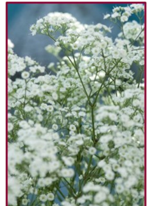
Van links naar rechts: Paarse wilde peen(Daucus carota dara, Margrietten, Gipskruid.

Eigenlijk alles wat je zelf leuk vindt, dat maakt een boeket persoonlijk en in je eigen stijl.