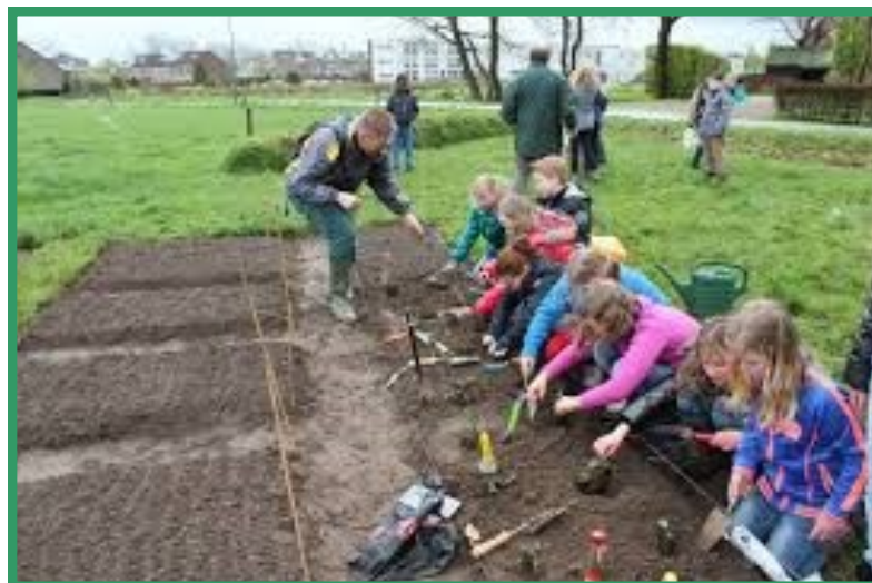
Jong geleerd oud gedaan (schooltuin)