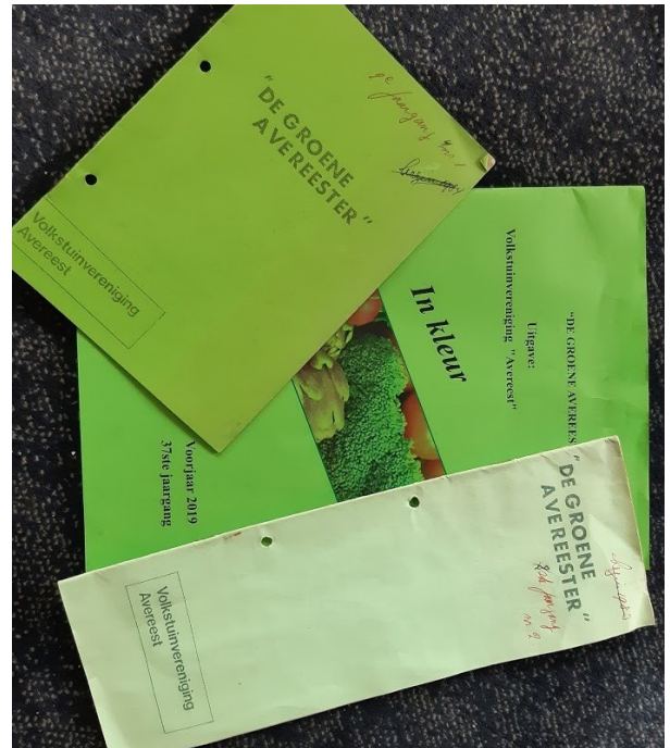
Drie Groene Avereesters:

Onder: een van de eersten. Boven : jaren '90