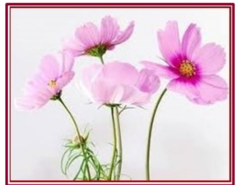
Van links naar rechts: Bekermalva ( Lavatera trimestris ), Bonte salie ( Salvia viridis ), Cosmea