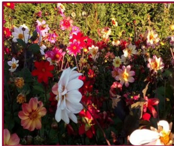
Foto's van een groep dahlia's in de vlindertuin

De zomerbol dahlia is een van oorsprong een Mexicaanse plant en is populair als snijbloem en als borderplant. De vele soorten dahlia's zijn onder te brengen in een aantal categorieën. Zo heb je drie verschillende bloemvormen: enkelbloemige, halfgevulde en gevulde dahlia's. Onder deze drie bloemvormen kennen we pompon, ster, cactus, waterlelie, anemoon, decoratieve en girafdahlia van een optimale start voor een prachtige bloei.