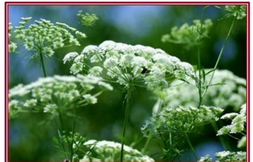
Van links naar rechts: Duifkruid(Scabiosa), Zinnia, Witte groot akkerscherm(Ammi majus)