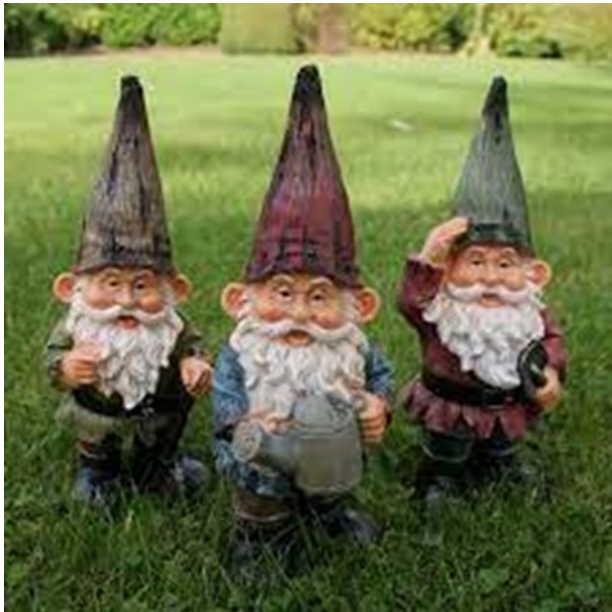
Van links naar rechts: Henkie, Henk en Willy

De kabouters Henk en Henkie gaan aardappels poten. Henkie heeft al een hele tijd geoefend om de poters goed in de gaten te mikken. De hele winter is hij bezig geweest in zijn huisje. Een paar lege blikjes op de vloer en daar pingpongballen proberen in te gooien. Maar nu moet Henkie het echt doen. Hij mag niet al te veel doen, want hij is pas door dokter Siepelaria geopereerd. Ook zijn vriendje Henk is door dezelfde dokter behandeld.